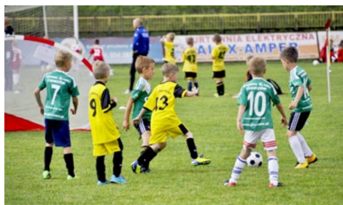
Młodzi piłkarze dali z siebie wszystko, walcząc o każdego gola

grywek jest zapewnienie świetnej zabawy młodym adeptom futbolu. Dzięki wsparciu gminy oraz prywatnych sponsorów, możemy zapewnić uczestnikom wspaniałe nagrody, co nie tylko podnosi rangę turnieju, ale zapewnia też dużo atrakcji i zabawy dla uczestników. Wszystko to sprawia, że nasze miasto chętnie odwiedzane jest przez inne kluby. W tym roku pogoda dopisywała, a zabawa była świetna. Doping rodziców i ciekawa sportowa rywalizacja spowodowały, że emocji nie brakowało. Dzieci wraz z rodzicami spędziły w Radzionkowie wiele godzin na sportowo, ciesząc się piłką nożną. Z radością oczekujemy na kolejną edycję turnieju Cider Cup. ■