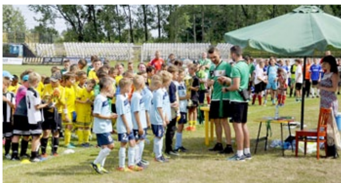
Na zielonej murawie nie brakowało sportowych emocji

Organizatorem turnieju, jak co roku był UKS „Ruch” Radzionków, wspierany przez Urząd Miasta. Zawody odbywają się przy okazji obchodów Dni Radzionkova, a udział w nim bierze wiele klubów zarówno ze Śląska, jak i z innych województw. Głównym celem roz-