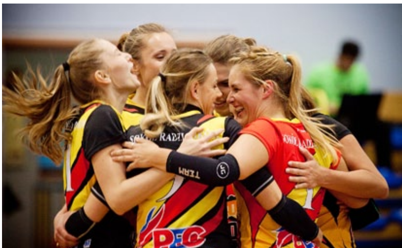
Siatkarki zapowiadają ostrą walkę w nowym sezonie

– Ciężko jest w chwili obecnej określić cele, jakie sobie stawiamy. Rywalizować będziemy z dziesięcioma bardzo dobrymi zespołami. W tym sezonie nie będzie słabych zespołów. Mysłowice mają za sobą występy w 9 pierwszej lidze, a Pszczyna która od dwóch lat usilnie walczy o awans do pierwszej ligi, pompuje w klub wielkie fundusze. Nie zapominajmy o rewelacyjnej drużynie z Jawora, Szczyrku czy o Częstochowiance, z którą jeszcze nie udało nam się wygrać. Do nowego sezonu przystępujemy kolejny już raz jako najbiedniejszy klub, lecz z wielkim sercem do walki. Pewnym jest, że chcemy godnie reprezento-