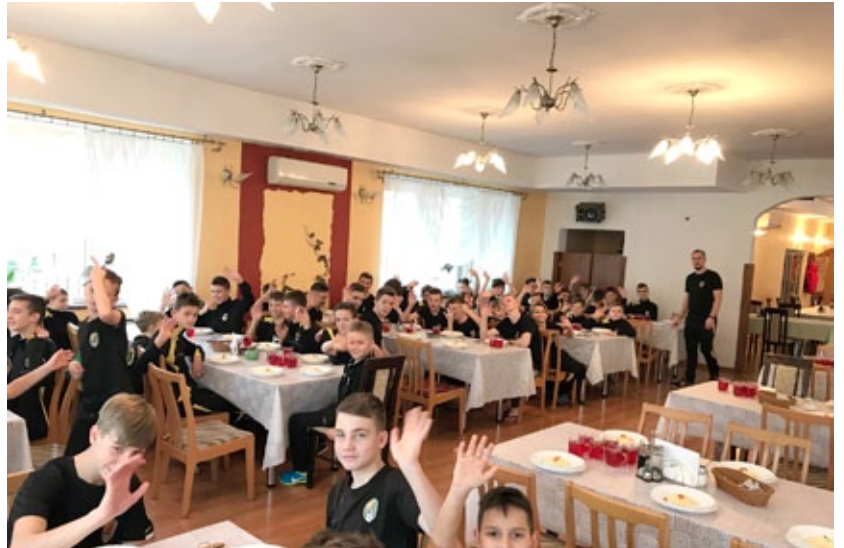
Młodzi piłkarze przygotowywali się do sezonu w Jarnołówku-Pokrzywniej