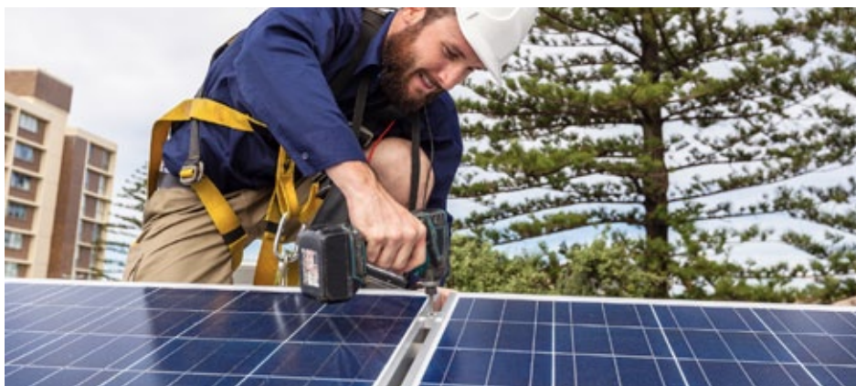
Montaż kolektorów słonecznych

Nasze miasto zamierza sięgnąć po środki unijne na walkę z uciążliwym smogiem. Potrzeba tylko chęci i zaangażowania mieszkańców Radzionkowa. Tym razem będzie można uzyskać pieniądze na dofinansowanie do zakupu i montażu odnawialnych źródeł energii. Na co konkretnie będą środki i jak się o nie starać, piszemy na kolejnych stronach. Przeczytaj i koniecznie przyjdź na spotkanie!