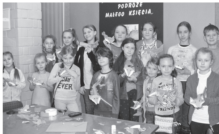
Podróże „Małego księcia” były motywem przewodnim ferii w bibliotece

Choć śnieżna aura nie dopisała, ferie w naszym mieście były udane. Na najmłodszych w dniach 15-26 lutego czekało wiele atrakcji!