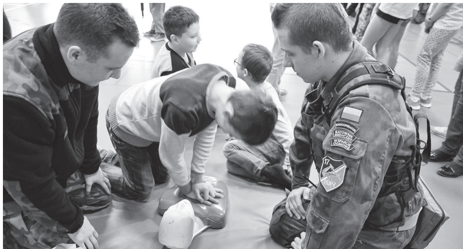
Podczas zajęć z żołnierzami dzieci mogły nauczyć się podstawowych zasad pierwszej pomocy