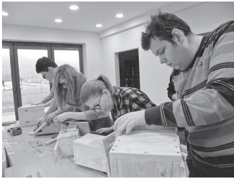
Dzieci i młodzież chętnie biorą udział w zajęciach laboratoryjnych i warsztatach przyrodniczych