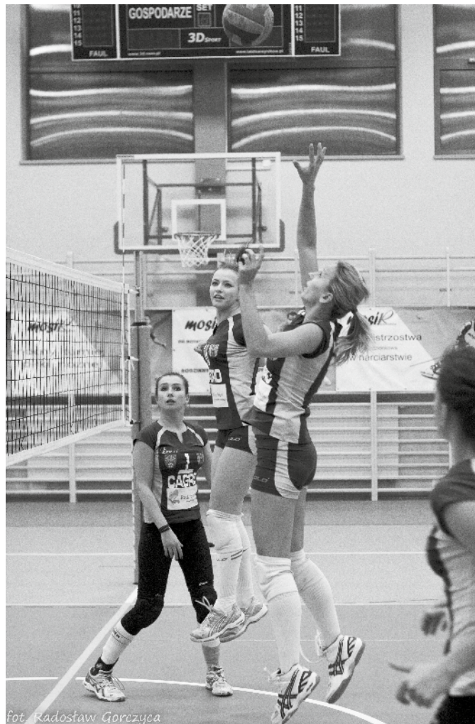
Fot. Radosław Gorczyca

Pierwsza konfrontacja w nowych warunkach i z zaproszonymi drużynami innych klubów odbędzie się już 12 czerwca br. podczas corocznych obchodów Dni Radzionkowa. W tym dniu swoje umiejętności zaprezentują obydwie nasze druży-